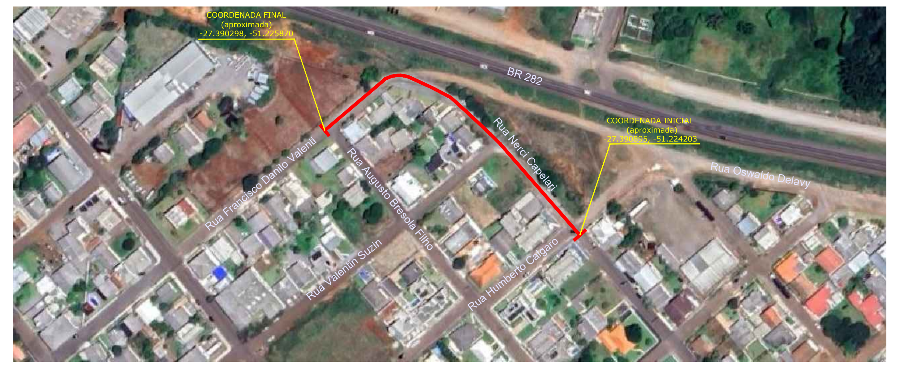
IMAGEM AÉREA / LOCAÇÃO ESCALA...: Sem Escala