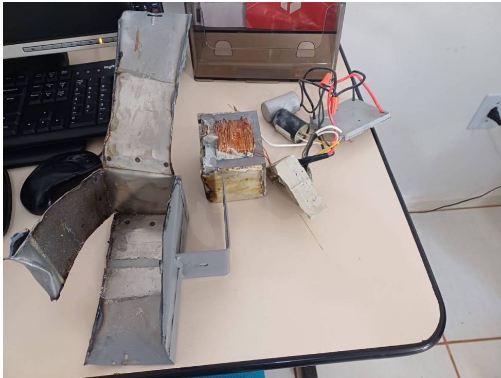
Anexo 3. Teste