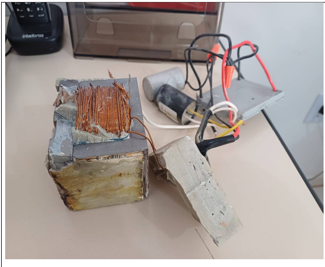
Anexo 2. Abertura do Reator