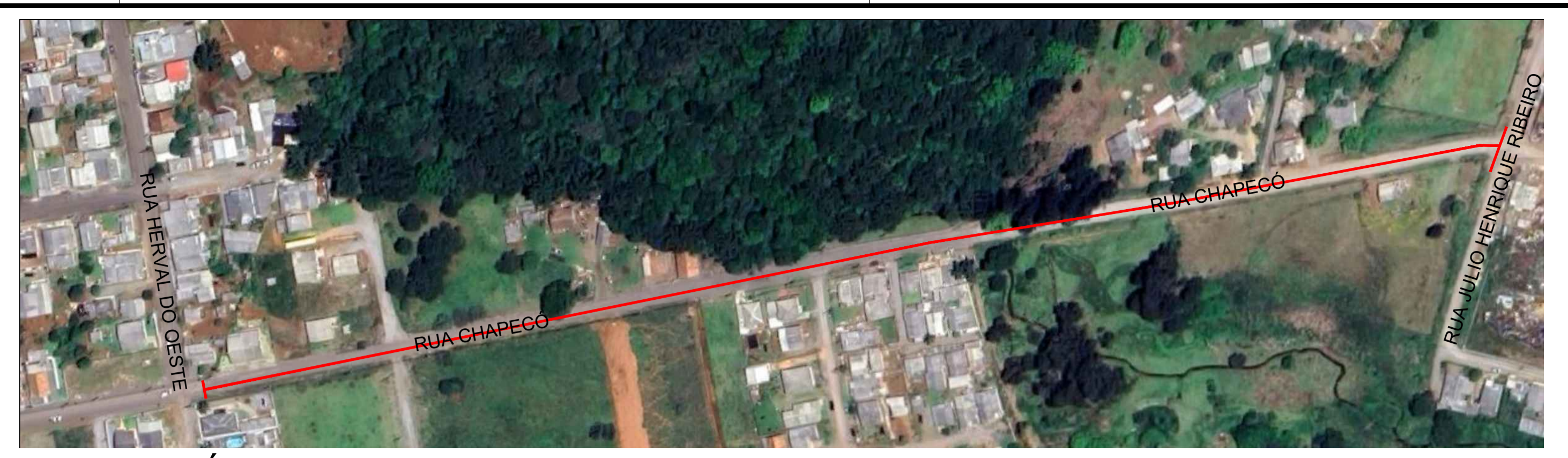
IMAGEM AÉREA ESCALA...: Sem Escala