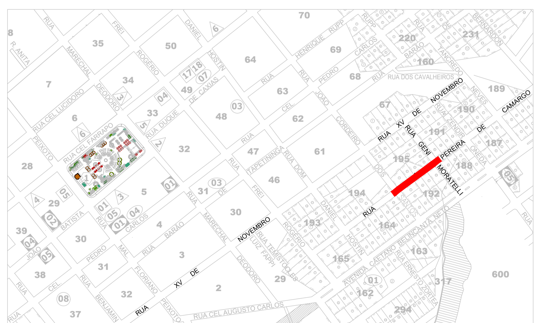
PLANTA DE SITUAÇÃO ESCALA...: Sem Escala

ANOTAÇÕES: TODAS AS MEDIDAS ESTÃO EM METROS, CASO HOUVER DIVERGÊNCIAS ENTRE COTAS E ESCALA, PREVALECERÃO AS COTAS.