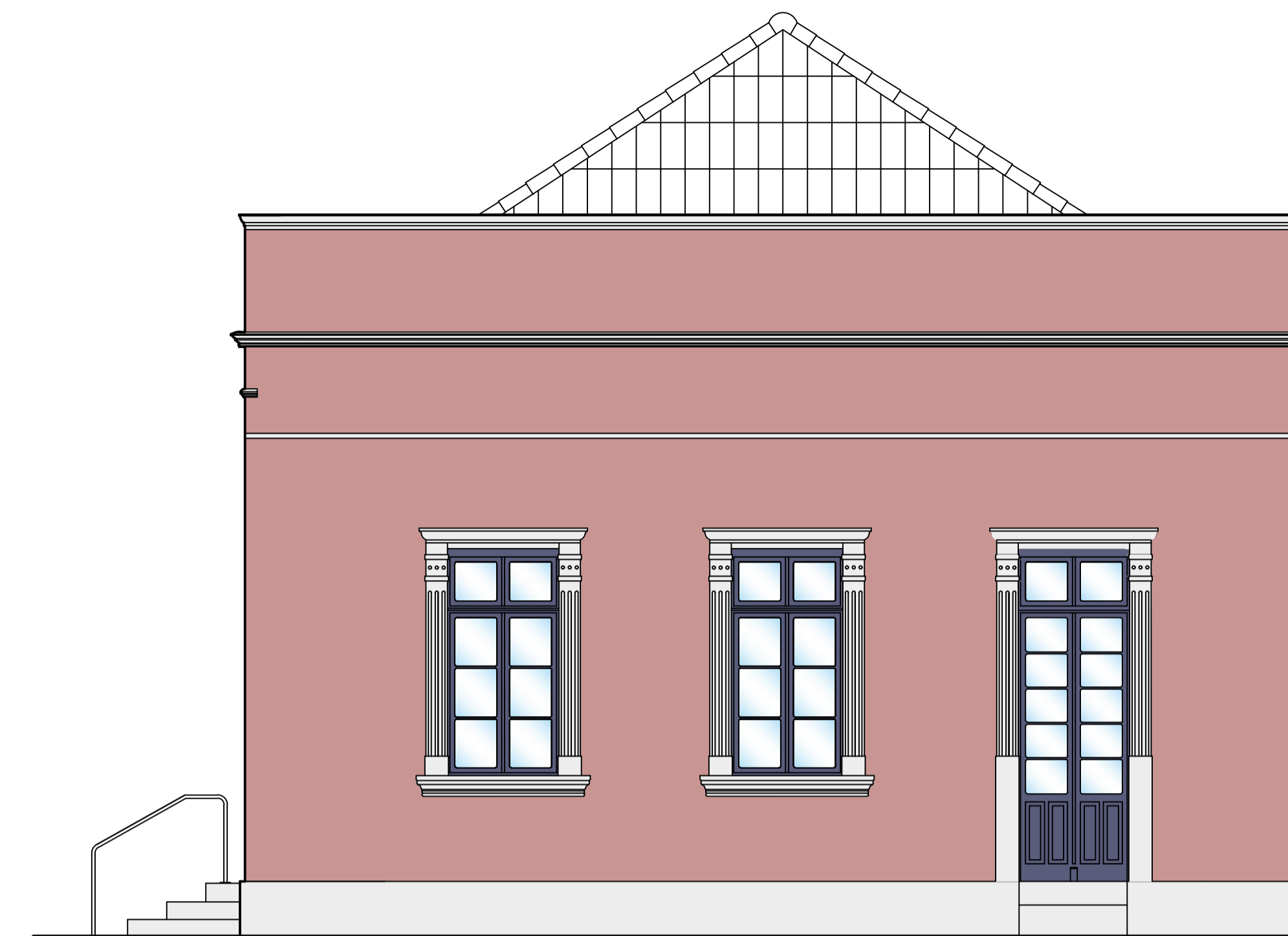
ELEVAÇÃO 02 ESCALA 1/50