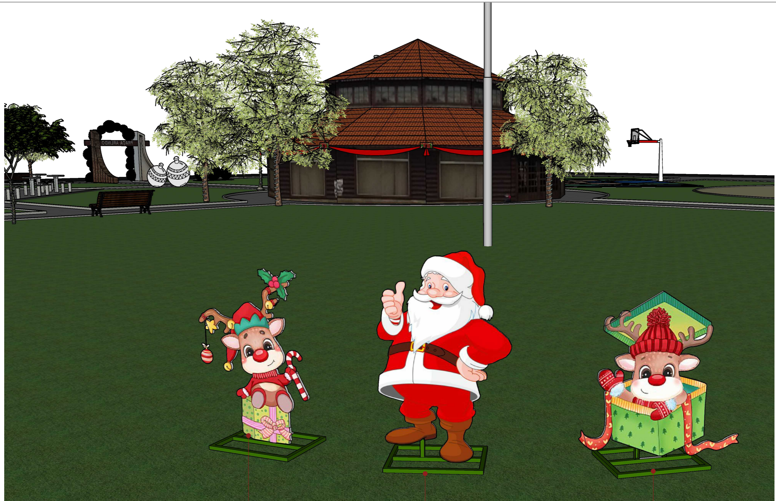
1 PERSPECTIVA PRAÇA ARLINDO BESS 01 SEM ESCALA