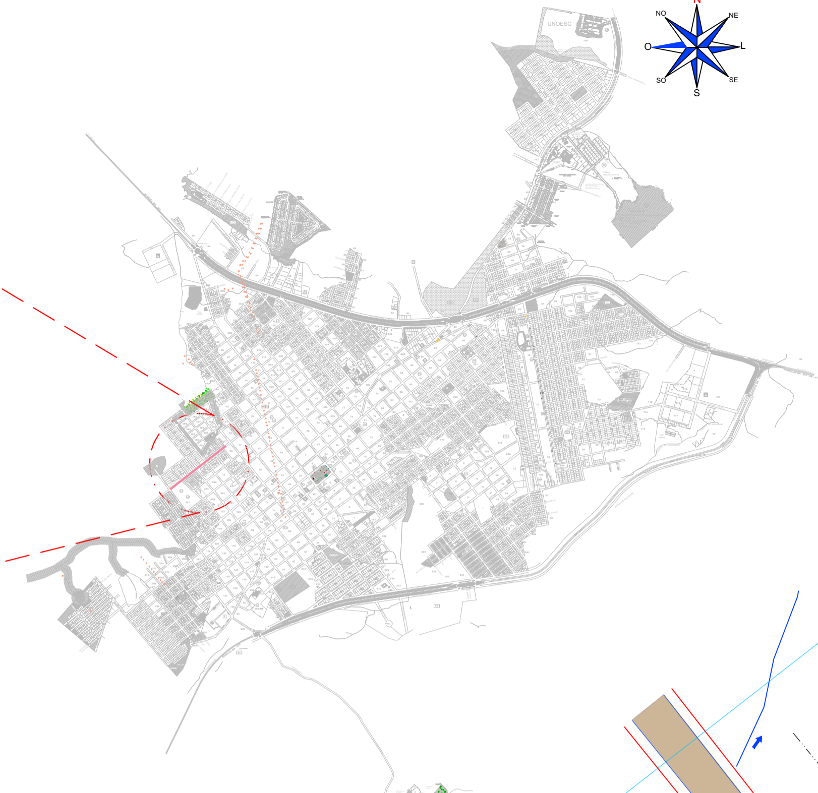
PLANTA DE SITUAÇÃO ESCALA...: Sem Escala