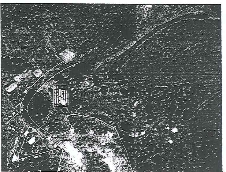
TABELA DE AZIMUTES, DISTÂNCIAS

6966780 6966770 6966760 6966750 6966740 6966730 6966720 6966710 6966700 6966690 6966680 6966670 6966660 6966650 6966640 6966630 6966620 6966610 6966600 6966590 6966580 6966570 6966560 6966550 6966540 6966530 6966520 6966510 6966500