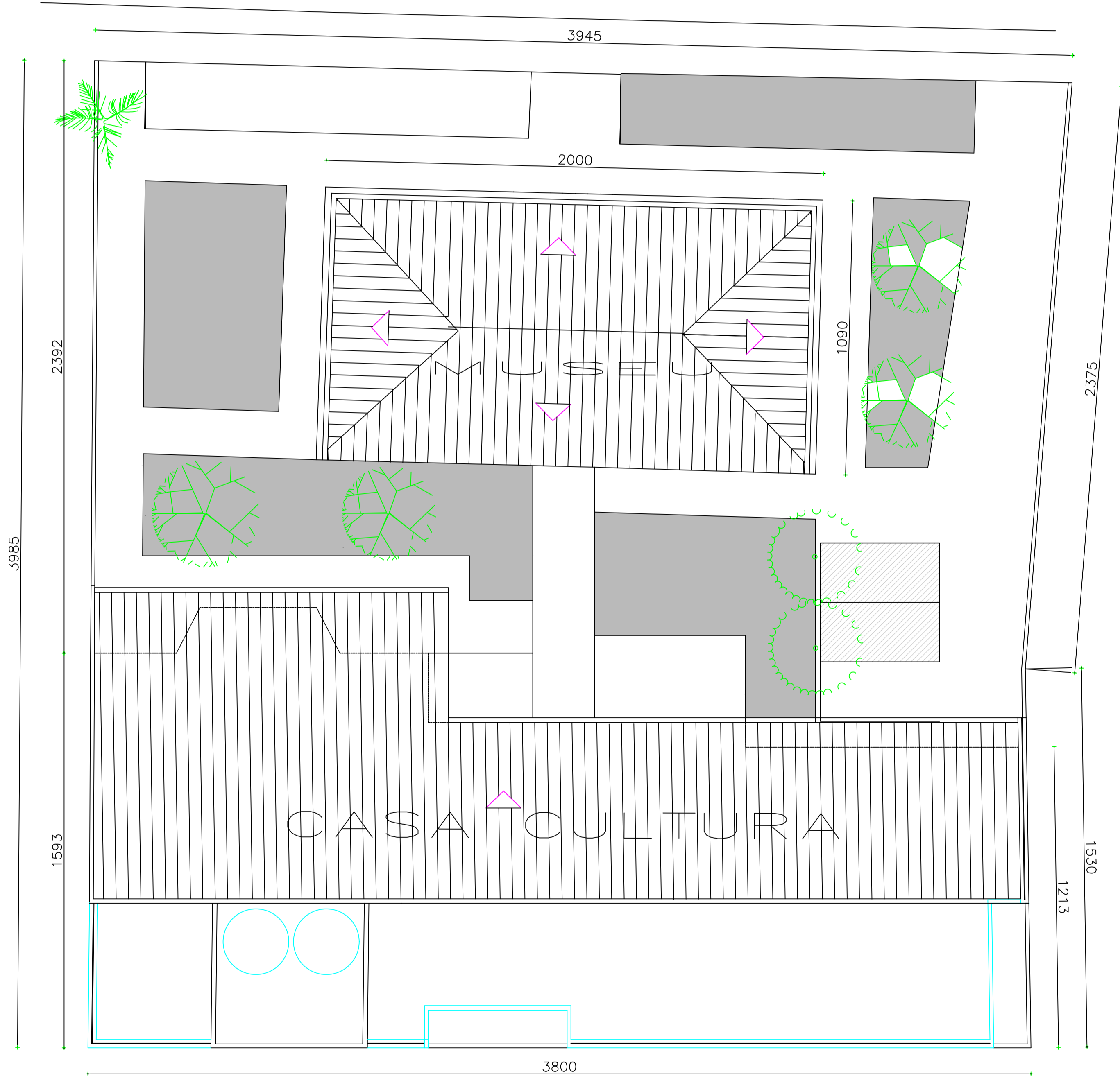
SITUAÇÃO - ESC. 1/200