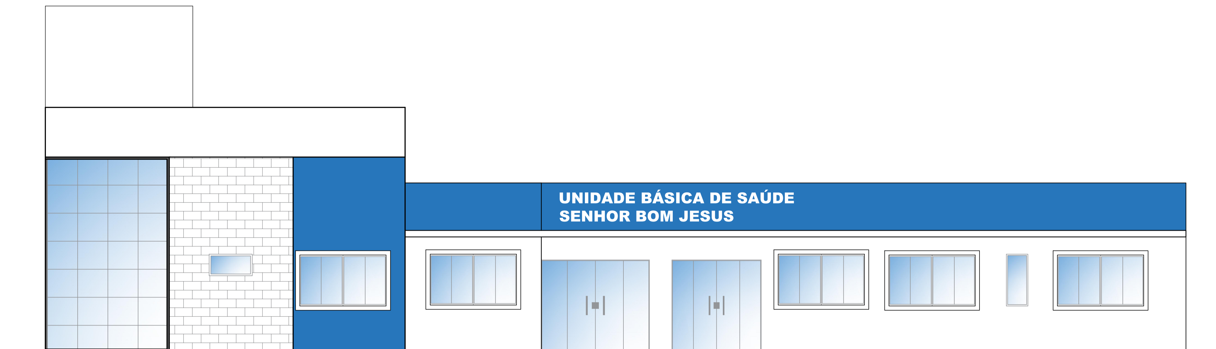
FACHADA FRONTAL ESC. 1:50