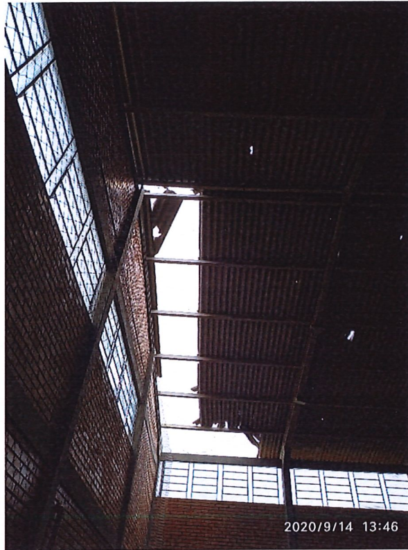
Figura 04: Cobertura a ser substituída