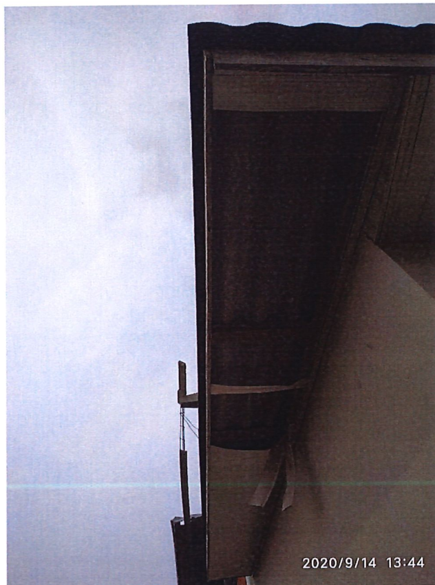
Figura 06: Beiral em PVC danificado