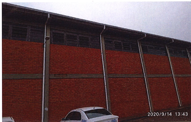
Figura 02: Esquadrias a serem substituídas