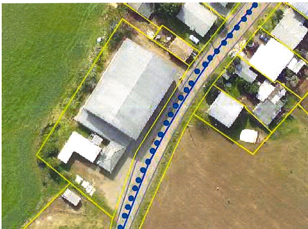
Figura 01: Vista aérea da área de projeto.

O projeto em questão refere-se à substituição de cobertura e esquadrias no Ginásio de Esportes localizado no Distrito Encruzilhada, edificação de uso público, com área total edificada de 792,43m 2 que após evento climático (tempestade local/convectiva - vendaval) ocorrido em 30/06/2020 resultou no comprometimento da funcionalidade da edificação, sendo necessário substituição de telhas de fibrocimento da cobertura, substituição de janelas basculantes que tiveram seus vidros quebrados e recolocação de beiral em PVC danificado com a tempestade.