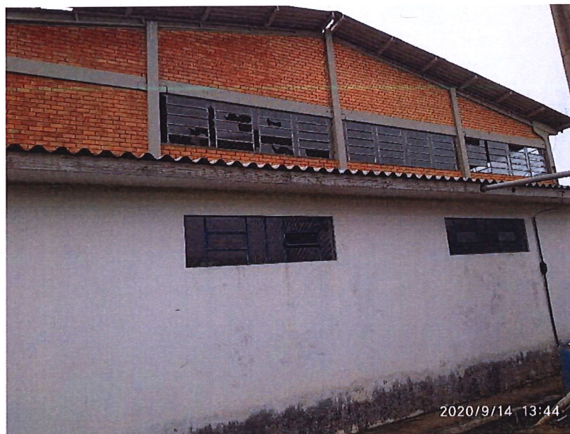
Figura 03: Esquadrias a serem substituídas