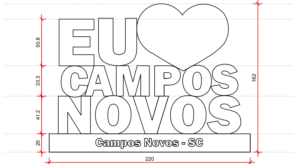
VISTA FRONTAL ESC.: 1: 25