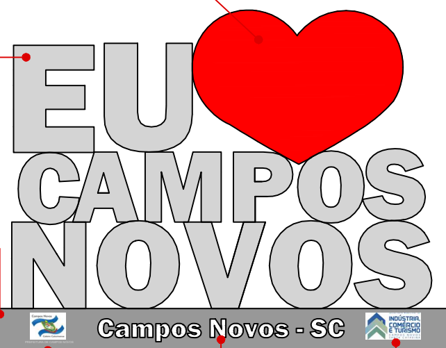
VISTA FRONTAL ESC.: 1: 25

ADESIVO COM A LOGO DA SECRETARIA DE INDÚSTRIA, COMÉRCIO E TURISMO